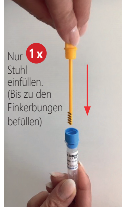
Nur 1x Stuhl einfüllen. (Bis zu den Einkerbungen befüllen)