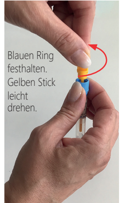
Blauen Ring festhalten. Gelben Stick leicht drehen.