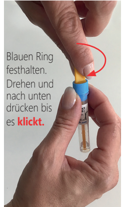
Blauen Ring festhalten. Drehen und nach unten drücken bis es klickt .