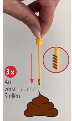
3x An verschiedenen Stellen.