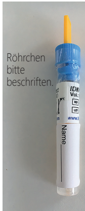
Röhrchen bitte beschriften.

S559020 IABC Anleitung zum Histamintest ger. Vers. 02.09.2019